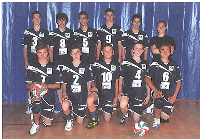
équipe Regroupement Licences Seyssins- Claix Championne Départementale 2013 - cadets

Un regroupement de licences a été mis en place lors de la saison 2012-2013 pour une équipe dans un championnat départemental cadets 6x6, ainsi qu'une équipe dans un championnat minimes 4x4.